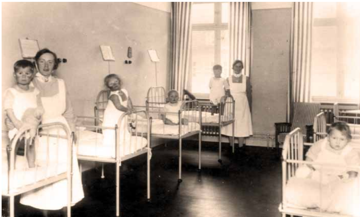
Interiör från barnkliniken i Lund, första halvan av 1900-talet