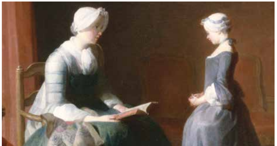
"The Good Education", Jean-Siméon Chardin, c. 1753

Om detta akademikerpar, glömt sen länge, berättade arkivarie Fredrik Tersmeden på Gamla Lunds februarimöte.