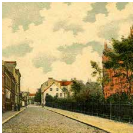
Grönekatan, med en bit av Katedralskolan till höger. Äldre vykort.

Inför gymnasievalet hade jag hyggliga betyg och kunde komma in på Spyken, reallinjen, som var mitt önskemål. Döm om min förvåning när jag fick besked att jag kommit in på Katedralskolan, denna pluggskola som jag ville undvika. Efter lite bråkande med skolkontoret ändrade de beslutet och jag kom in på Spyken. Senare fick jag veta att skälet för det första beslutet var att Katedralskolan var helstatlig och därför slapp Lunds stad att betala terminsavgift för sina elever.