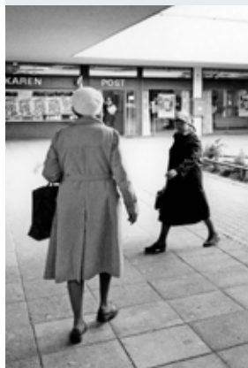
Klostergatans centrum, tidigt 70-tal.