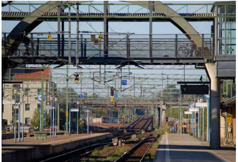
Stationsområdet 2006.

– Ni har ju ett guldläge i Lund, men ni utnyttjar det inte tillräckligt. Stan är en mötesplats, men har man tänkt på hur centrum ska fungera för en befolkning på kanske 200 000 om tjugo år? Studenter ska inte bara vara underlag för kaféer. Låt ungdomarna vara med och forma framtiden. Det räcker inte med skyltar om