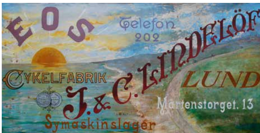
Reklamskylt för cykelfabriken EOS. Ovan: Berlingska boktryckeriet och Stilgjuteriet.