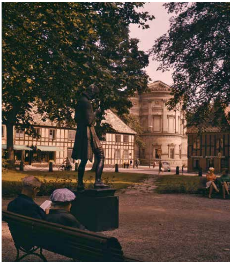
Petriplatsen med statyn av Carl von Linné – nu mycket uppskattad, men alla ville inte se en uppsaliensare som staty när den 1938 kom på plats.

Linné såg en gudomlig tanke bakom Naturens ordning – från det kosmiska ner till den minsta insekt. Han var fascinerad av skapelsen och tvekade inte om att världen var skapad av Gud. Men han hade en naturvetenskaplig ansats och det var ett revolutionerande steg att sortera in människan bland apdjuren.