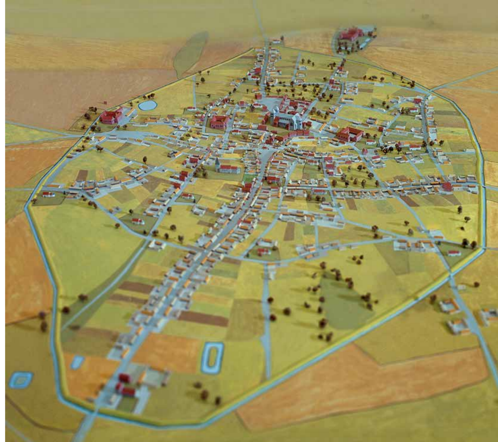
Modell av Lund som staden såg ut ungefär år 1500 – före reformationen. Modellen finns på Kulturen.