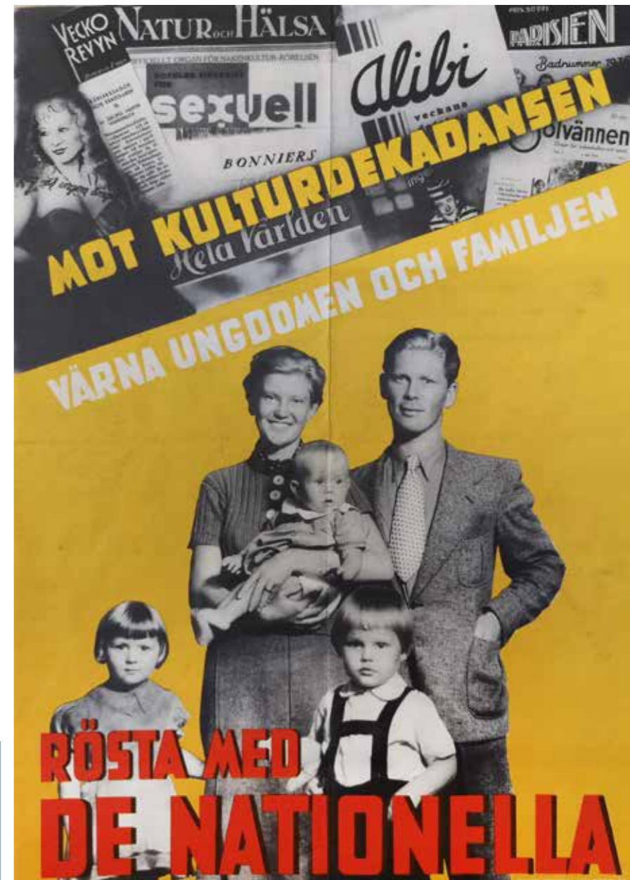
Valaffisch för De nationella, 1934. "Mot kulturdekadansen. Värna ungdomen och familjen. Rösta med de Nationella".

SNF växte fram ur Sveriges nationella ungdomsförbund (SNU) grundat 1915. SNU fungerade som ett självständigt ungdomsförbund till Allmänna valmansförbundet, högerns valorganisation. År 1934 kom det till en brytning mellan högern och SNU. Den har ansetts vara en viktig brytpunkt i högerns historia. Först från denna tid tog högern klar ställning för den liberala demokratin. Inom SNU fanns starka antidemokratiska krafter och ett stort intresse för reaktionära och fas-