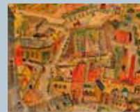
Arkitekterna som formade Lund – ett lexikon Bo Larsson, redaktör

Som arkitekt kan man lyfta fram Värmlands nation (1949 och 1957), Rosengården på Pedellgatan, radhusen vid Tingshögsvägen och hans sista större arbete: kvarteret S:t Peter mellan Bredgatan och S:t Laurentiigatan, uppfört 1979-1980.