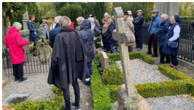
Förra vandring i höstas