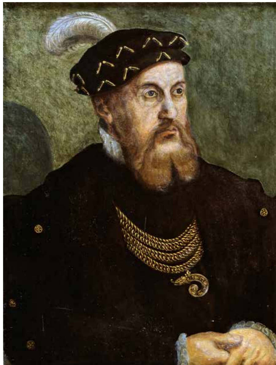
Kristian III, dansk kung 1534–59, ses här i en porträttmålning från 1550-talet. Kungen ledde genomförandet av reformationsverket i Danmark 1536–37, vilket fick långtgående konsekvenser för landets tidigare ledande katolska centrum, ärkebiskopsstaden Lund.