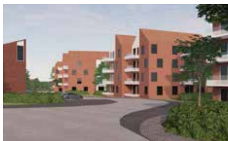
Vyer av de planerade punkthusen, Illustration: Jaenecke Arkitekter.

skapa mer mångsidiga stadsdelar, men det finns också en önskan av att bevara tidstypiska stadsmiljöer och byggnader, ofta med betydande arkitektonisk kvalitet. Det behövs en analys av vilka bebyggelsemiljöer som bör bevaras på längre sikt – en fortsättning på befintliga bevaringsplaner – och hur detta bör påverka detaljplanerna. Var går gränsen för vilka byggnader som bör q-märkas och när bör rivningsförbud införas? Detta gäller såväl bostadshus som skolor, institutioner, kontor- och annan verksamhetsbebyggelse. Detta blir kommande diskussionsfrågor, som bland annat kan aktualiseras av sjukhusplanerna.