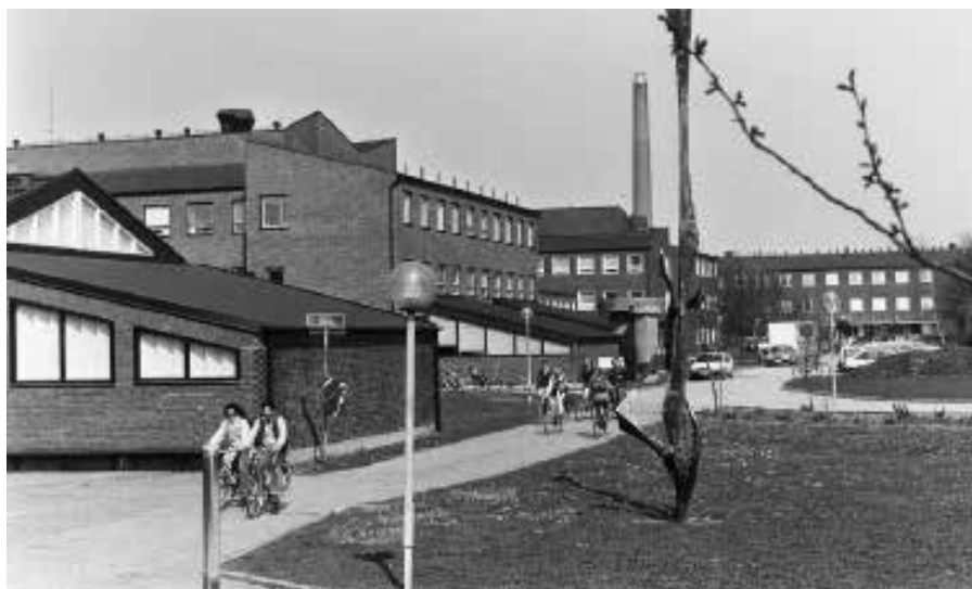
Medicinarlängan med Fysiologens hörsal och Patologen i förgrunden. Arne Jones skulptur ”Vertikal komposition” (1956) till höger (numera borttagen). Foto: Lennart Olson 1994.

Beskrivningen kan också gälla Patologen, Bakteriologen/Virologen, Mikrobiologen och Rättsläkarstationen. Med utgångspunkt från varje institutions speciella behov har Anshelm med en sammanbindande