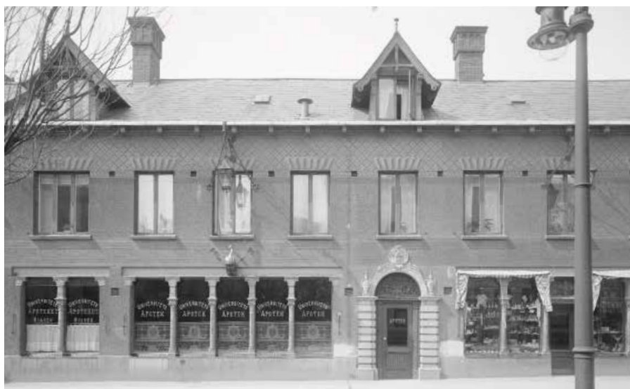
Apoteket Svanen på Kyrkogatan fotograferat av Per Bagge. Odaterad bild i UB:s samlingar.

Ännu mera praktfull blev nästa ombyggnad. År 1897 uppdrog apotekaren och ägaren Fredrik Montelin åt Folke Zettervall att göra en ny ge-