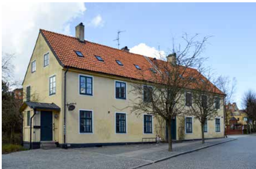
Sylwanska gården på Råbygatan.

Han har i sina minnen berättat om sin tid på Arbetsförmedlingen.