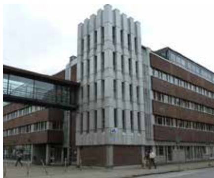
Arbetsförmedlingens sista hus på Stora Södergatan.