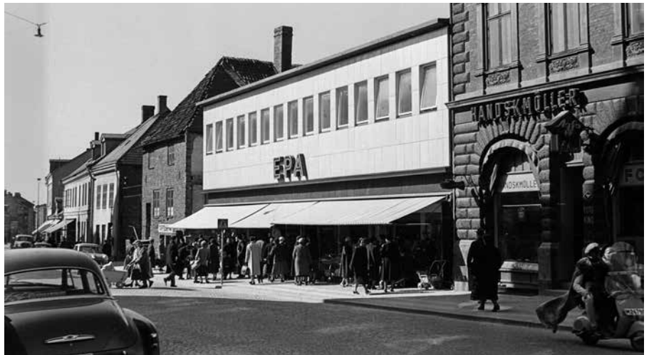
När EPA öppnade 1931 fick Lund sitt första stora varuhus. Utställningsbilden är från 1955.

Ett höghus fungerar som tittskåp där den som kikar in kan se hur