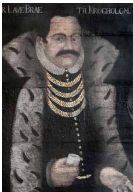
Lave Axelssen Brahe