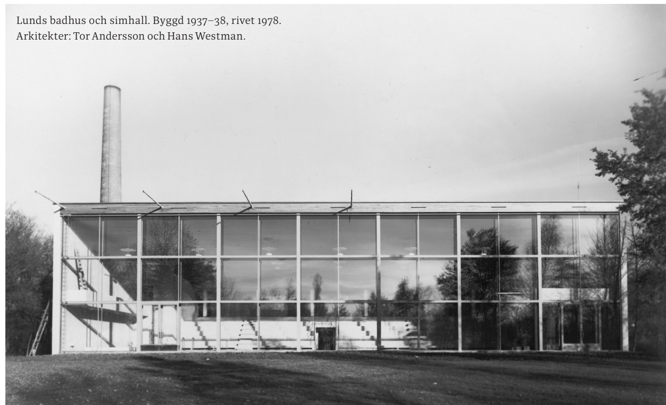
Lunds badhus och simhall. Byggd 1937–38, rivet 1978. Arkitekter: Tor Andersson och Hans Westman.

Sparta är byggt som en stad med inre gata och torg. Det blir mer intressant ju mer man studerar det. Men mycket är förändrat av det ursprungliga Sparta.