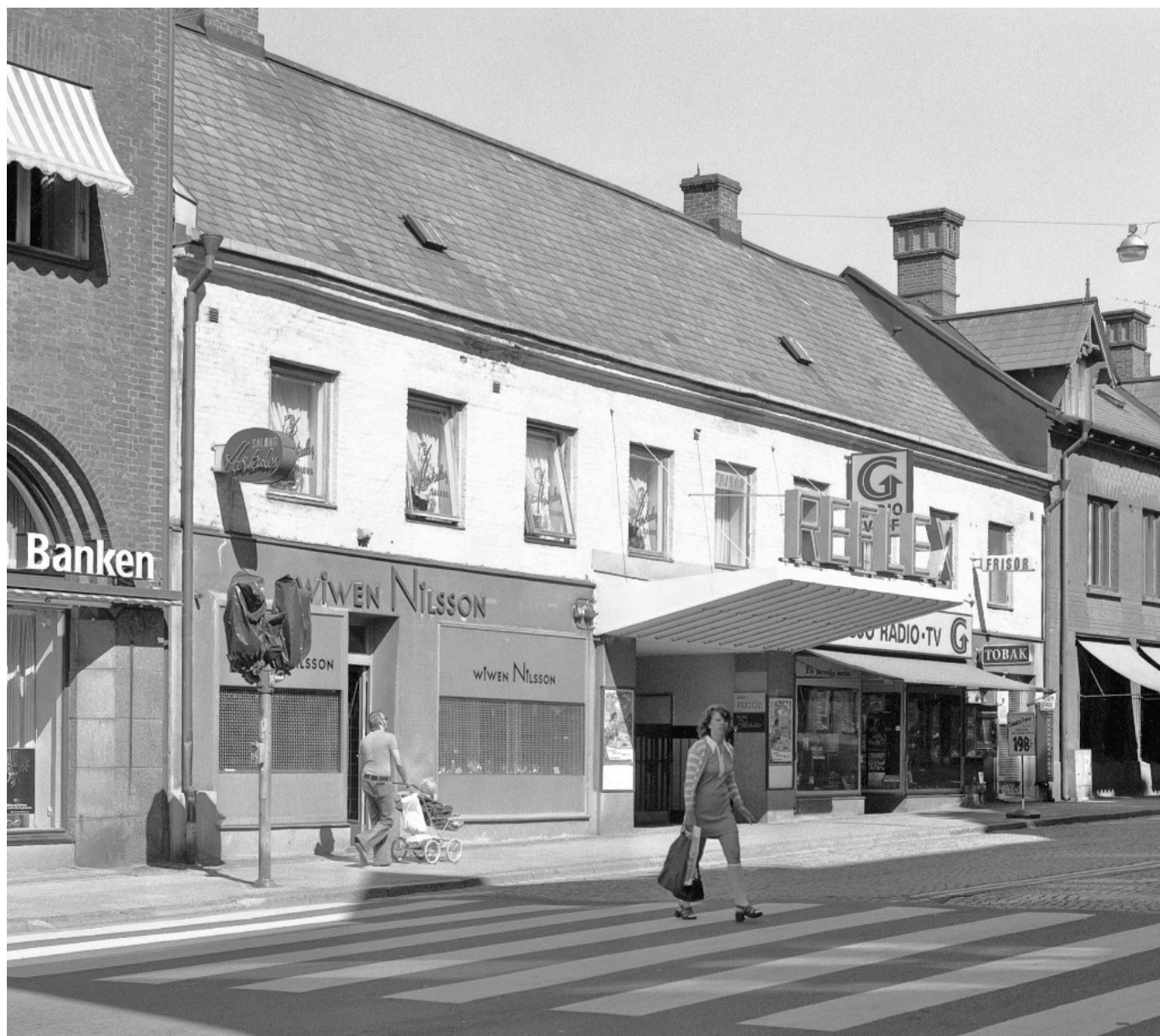
Kyrkogatan 1976.

en lucka täckte fönstret mot salongen vid en projektor åt gången. På så vis var det aldrig risk för dubbelvisning. Genom att titta på filmrutorna mot den svarta förfällda luckan vreds rätt position sakta fram manuellt, och så var det klart för start.