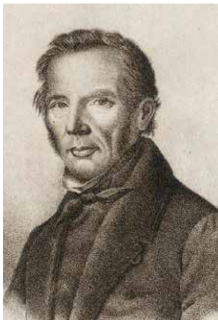
Carl Georg Brunius porträtterad av Magnus Körner.

tens delar fungerade som ett stödjande ramverk i vilket olika motiv med rundbågeform fogades in.