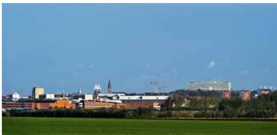
Lund sett från söder. Kennet Ruona, 2012.