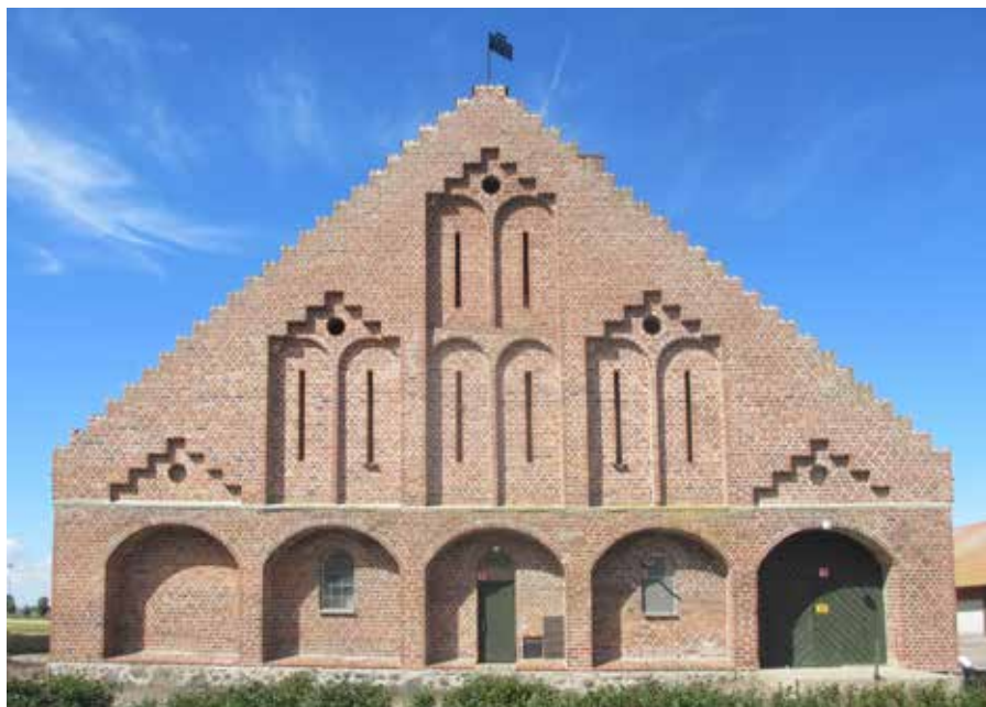
På Jordberga slott finns flera Bruniusbyggnader. Här den magnifika ladugården från 1841.

Universitetet som berövats undervisningslokaler genom rivningarna runt domkyrkan beslöt 1834 att bygga till sin huvudbyggnad, Kungshuset, med en tredje våning. Kungshuset var ett danskt renässansslott uppfört 1578–84, som på 1700-talet byggts om av Carl Hårleman och vars röda tegelmurar dolts bakom ljus puts. Brunius ritade ett ombyggnadsförslag, men universitetet valde Axel Nyströms. Liksom i domkyrkan fick Brunius en självständig roll som projektledare och bygget kom, föga förvånande, att i flera avseenden avvika från Nyströms förslag och närma sig Brunius eget. Han lät, i motsats till Nyströms helputsade fasad, putsa bara de två nedre våningarna och som dekorativ kontrast lät han deras nya fönsteromfattningar förbli oputsade och den nya tredje våningen stå helt i tegel. Brunius förde också in rundbågefönster i bottenvåningen och de nya gavlarnas utformning kan ses som en nytolkning i tegel av de principer han funnit i absiden. Gavlarna gjordes lite olika vilket var främmande för Nyströms klassiska grundhållning. Att variera gavlarna på i övrigt symmetriska byggnader var ett grepp som Brunius gärna tycks ha tillämpat. Troligen såg han det som