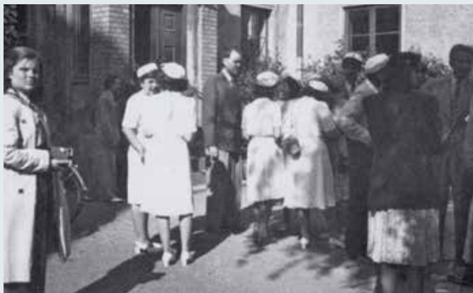
Studentexamen i Danska skolan i juni 1945.