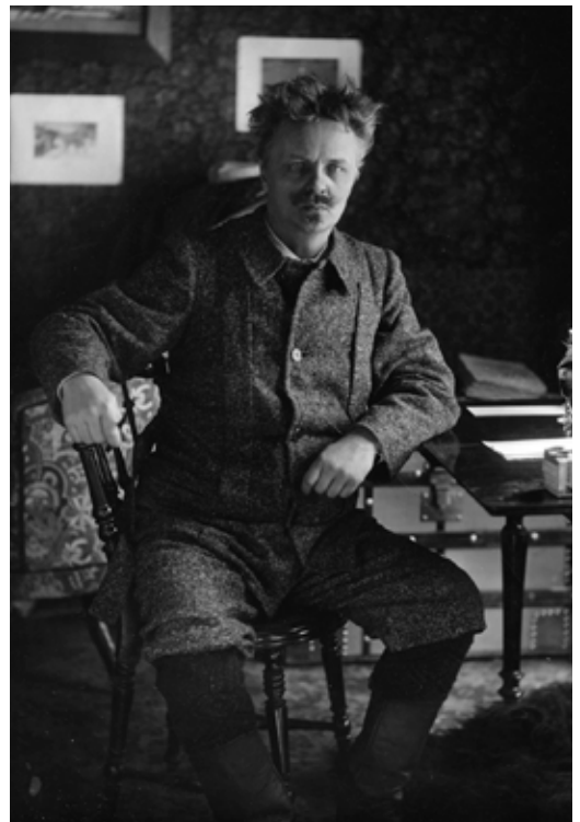
Strindberg i Lund 1897.

–Säkert har du den akademiska lärdomen, men jag har geniet. Skål på dig Johan! Aftonen blev mun-