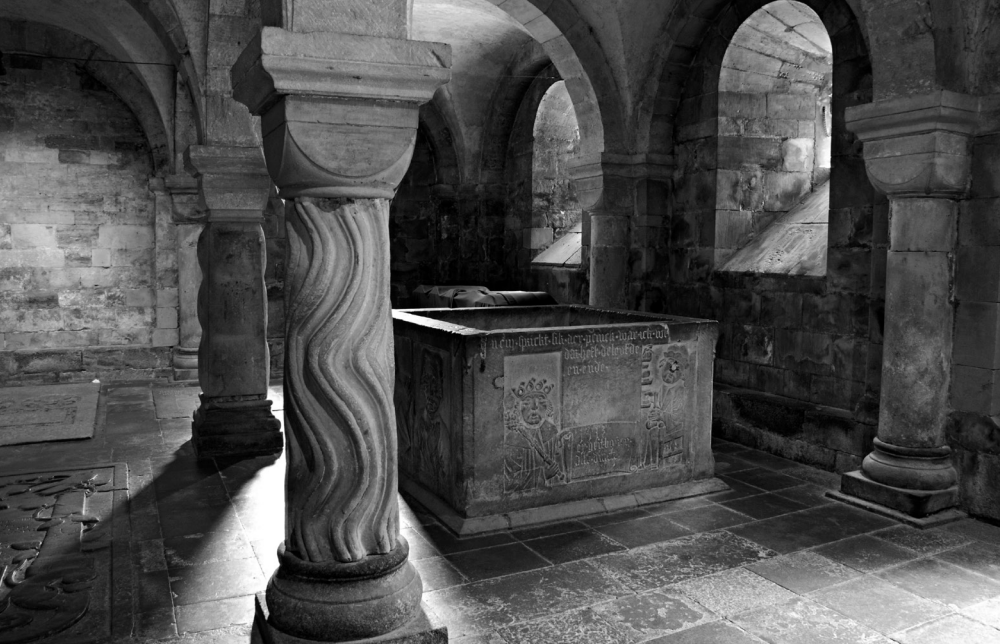
Brunnskaret i kryptan, skapat åren 1514-15 är ett av Adam van Dürens kända verk.