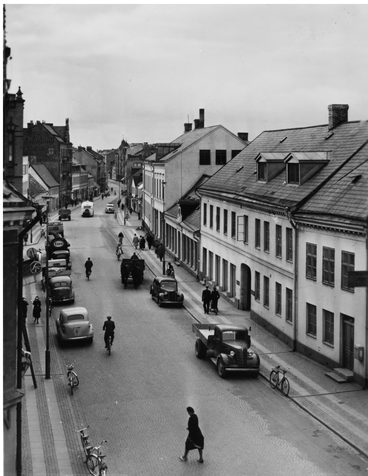
Stora Södergatan, från söder, på 1950-talet. Vykort ur årsboken Hälsning från Lund.