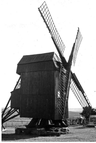
Odarslövs mölla.

Odarslövs mölla, Korsbäckamöllan, Nordströms mölla – kärt barn har många namn. Den gamla möllan som är märkt av tid, väder och bristande underhåll står där Lunds nya stadsdel Brunnsberg och "high-tech-område" ska växa upp. Nu är kommunen ägare och stadsantikvarie Henrik Borg hoppas den ska rustas upp och fungera som ett historiskt minnesmärke där den står.