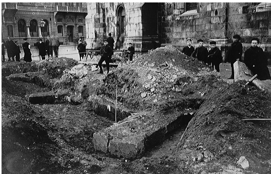
År 1908 gjorde Historiska museet en utgrävning av S:t Eriks kapell.

Arkeologiska fynd från området finns från 1890-tal fram till idag. Runt kyrkan har ett stort antal gravar påträffats, med alla kisttyper – trä, trästockar, sten och tegel – och även utan kista. Mängder av grundmurar har påträffats, bland annat från Sankt Eriks kapell, ärkebiskop Karls kapell, en strävpelare från ärkebiskop Peder Lyckes kapell och Adam van Dürens strävpelare. En vattenledning av tuffsten från 1100-talet och en vattenledning anlagd av Adam van Düren har