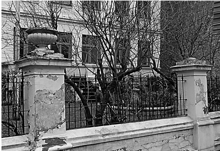
Skönhet i förfall på Bytaregatan.