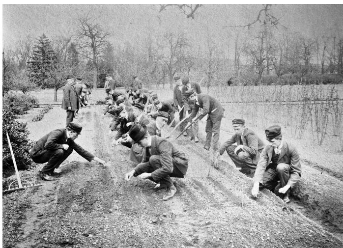
Min fars seminarieklass har trädgårdsskötsel omkring 1913. Bakom träden i bakgrunden ligger Allhelgonagården enligt en anteckning på fotografets baksida.