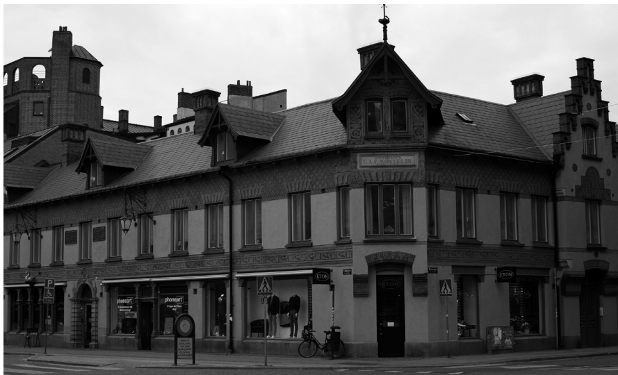
Det fina hörnhuset från 1862 med gamla Apoteket Svanen i hörnet Kyrkogatan/Klostergatan i Lund restaurerades av Paulssons.