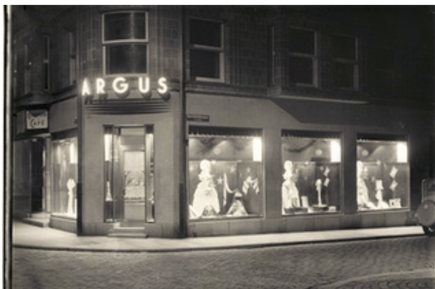
Argus underkläder.

Jensens ost var väl sorterad och populär. Bullis var en finare konfektyraffär av ty-