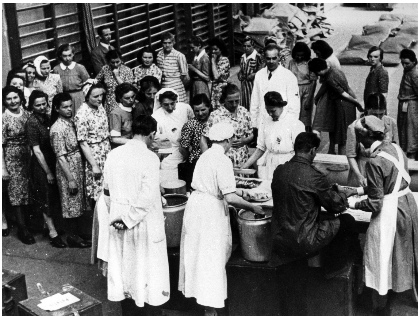
Utspisning av flyktingar i Lindebergsskolan i Lund 1945.

Förhandlingarna blev hårda och komplicerade och tillståndet var svårt att erhålla. Bussarna målades vita men försågs med röda kors för att demonstrera att de tillhörde Röda Korset och därför borde respekteras av de krigförande på ömse sidor. De Vita Bus-