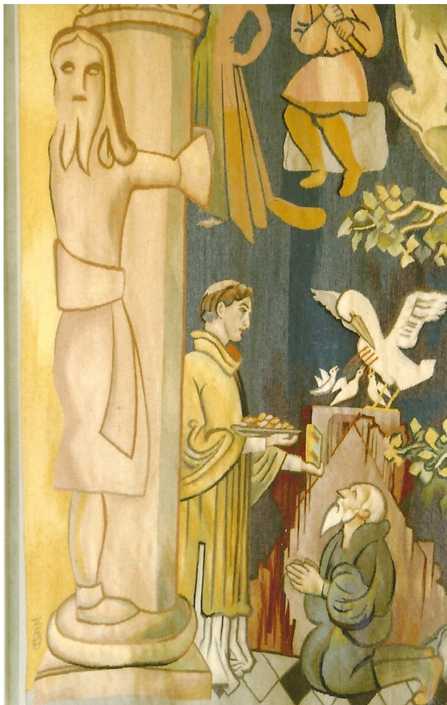
Detalj av nedre vänsta hörnet med Jätten Finn och domkyrkans skyddshelgon Sankt Laurentius som delar ut gåvor till de fattiga i Rom. Pelikanen ovanför som föder sina ungar med sitt eget blod är en symbol för Kristi offerdöd.

"Staden Lund med sin domkyrka bildar ett ramverk kring hela kompositionen",