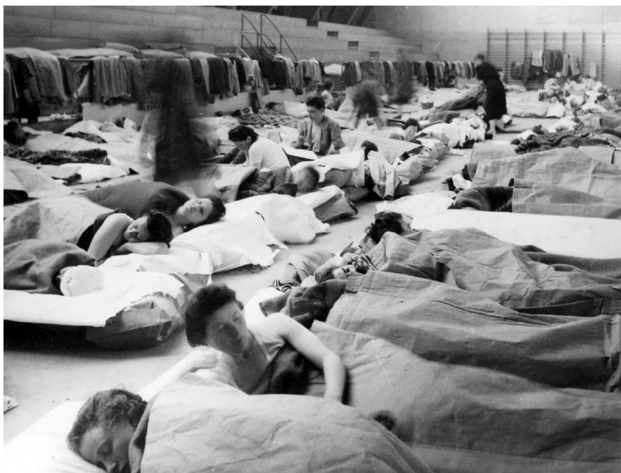
Gymnastiksal i Lund 1945.

I Lund var det idrottshallar och folkskolor som i första hand utnyttjades som flyktingförläggningar. De första anlände 28 april. Den dagen placerades 412