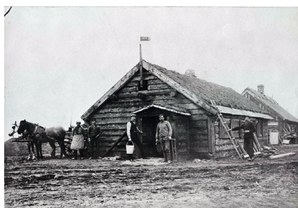
Onsjöstugan på Lantbruksutställningen i Malmö 1914.

Kansliet är semesterstängt 4 - 31 juli. TREVLIG SOMMAR önskar vi alla medlemmar!