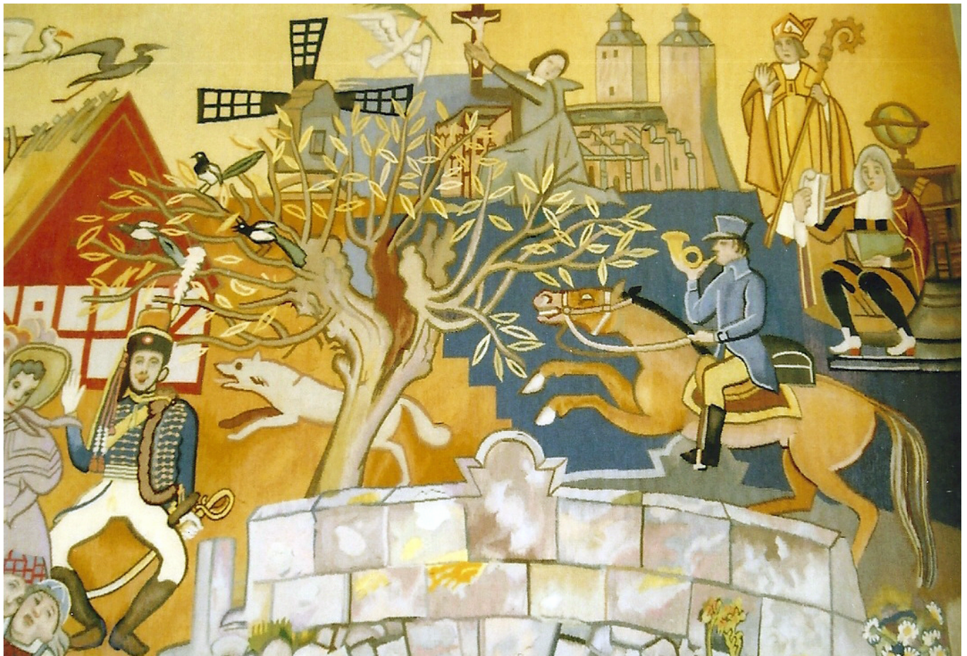
Detalj av övre högra hörnet med bland annat en postryttare, en präst, Lunds domkyrka på 1830-talet (före Zettervalls ombyggnad), biskopen i Lund samt Lunda universitets rektor med stiftelseurkunden.

och skriver att han har tänkt på Stagnelius berömda dikt Näcken. Den vänstra delen av gobelängen framställer Skogen som kontrast mot civilisationen i Staden och Bygden. Detta parti inramas av två vridna bokar, som konstnären tecknat av i Dalby Söderskog, och handlar om gamla sägner och trolltyg, "de underjordiska", som han skriver. Där ser man bland mycket annat en bonde som försöker betsla Bäckhästen, och där ovanför som en kontrast mot trolltyget ett heraldiskt lejon, en enhörning och en grip samt Torups slott med en kronhjort i vallgraven.