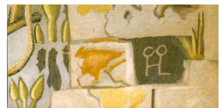
Detalj av nedre högra hörnet, Hilding Linnqvists signatur - HL med glasögon.